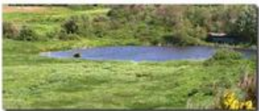
Le marais de Tardinghen

Quelques exemples d'écosystèmes présents dans les Parcs : mares, tourbières, forêts, bocage, etc.